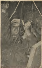
TRES LUNA BAO DI TERRA.

To modernize its short-haul fleet, KLM today also announced the exercise of its option to purchase six Dou-